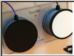
Un capteur par face du bâtiment